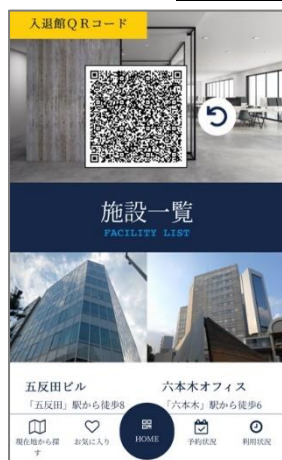
利用者施設検索画面

施設や店舗の予約から鍵の受け渡しと受付、利用実績管理、決済までの一連の流れをオンラインで完結 できるシステムです。管理業務に従事するスタッフを減らすことができるほか、物理鍵の受け渡しが必要になり、 省力化やセキュリティ強化 を実現します。