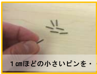
1cmほどの小さいピンを・・・