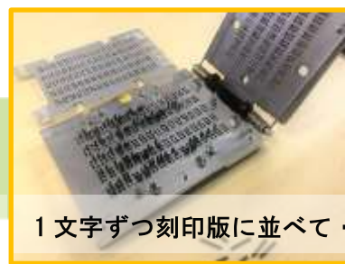
1文字ずつ刻印版に並べて・・・