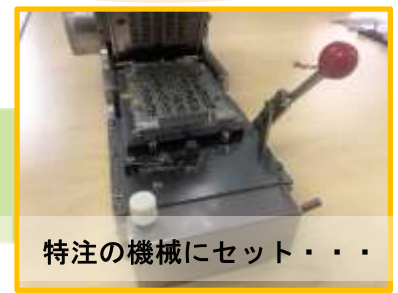
特注の機械にセット・・・