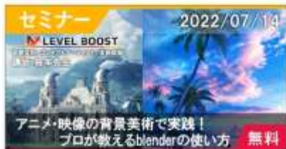
2022.06.25 7/14(木)18:00 アニメ・映像の背景美術で実践!プロが教えるblenderの使い方 無料