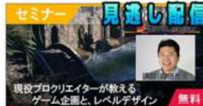
2022.06.08 【見逃】現役プロクリエイターが教えるゲーム企画と、レベルデザイン 無料