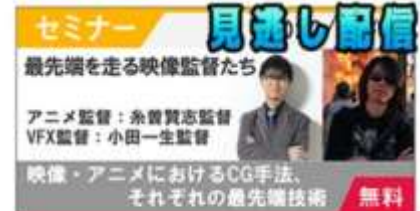
2022.06.08 【見逃】アニメ・映画の最先端CG技術と手法 無料